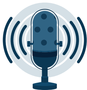
Spot radio, pub Mission Locale