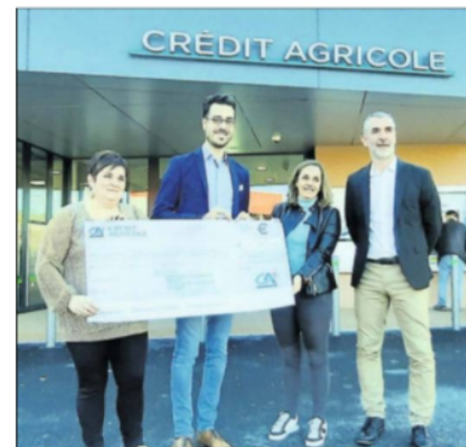
Un beau chèque pour la Mission locale qui accompagne de nombreux jeunes.

Cette année, c'est plus de 15 000 € qui ont été collectés sur la période de l'animation par le Crédit Agricole Nord Midi-Pyrénées. Ce dernier a fait le choix de répartir la somme issue de cette opération, sur les quatre départements de sa zone d'intervention (Aveyron, Tarn, Lot et Tarn-et-Garonne), auprès d'associations bien ancrées sur le territoire et répondant aux