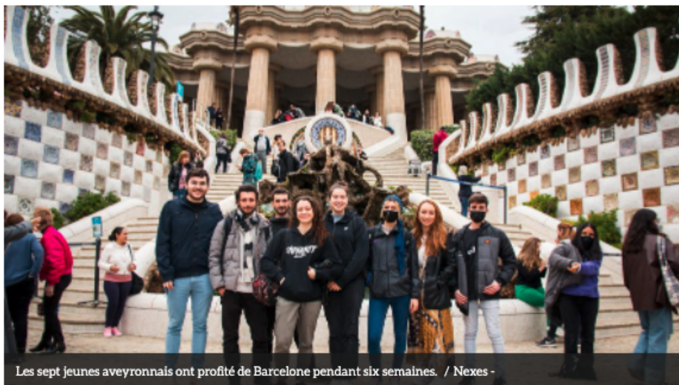
Les sept jeunes aveyronnais ont profité de Barcelone pendant six semaines.