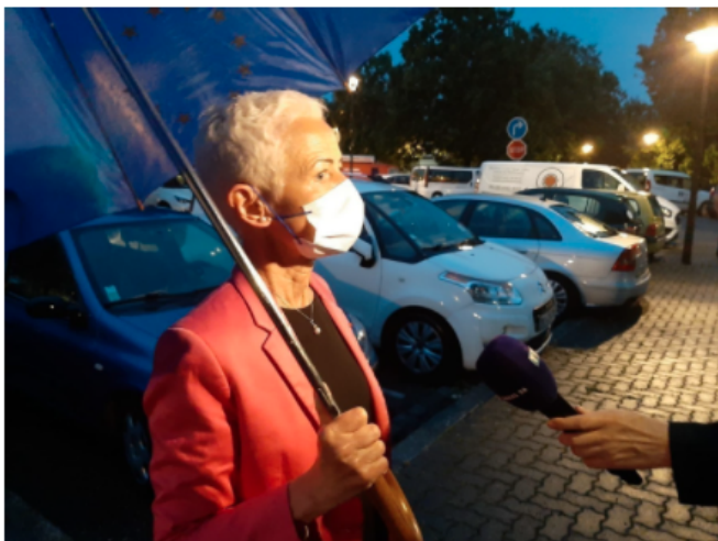
Brigitte Klinkert passera une partie de la journée dans l'Aveyron.

On est passé de l'automne à l'hiver, l'épidémie de Covid-19 a produit une nouvelle vague, mais le train d'enfer mené par le gouvernement en région ne faiblit pas. Comme tous les mois, l'Aveyron accueillera donc plusieurs ministres en février 2022. A commencer par celle de l'Insertion, attendue ce jeudi 3 février.