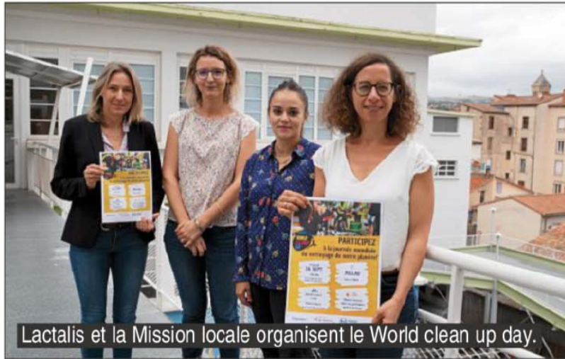
Lactalis et la Mission locale organisent le World clean up day.