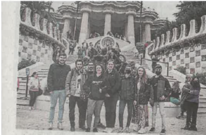
Les jeunes Aveyronnais au Parc Güell, à Barcelone.