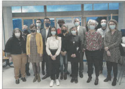
L'ensemble des acteurs de La Mission Locale, des partenaires, des élus et quelques jeunes étaient présents à l'inauguration des nouveaux locaux de l'antenne saint-affricaine.