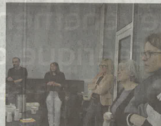
Les parrains interviennent en complément des conseillers.