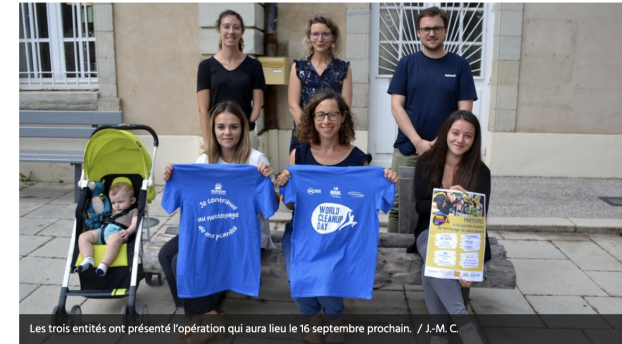
Les trois entités ont présenté l'opération qui aura lieu le 16 septembre prochain.